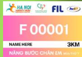
SỐ BÁO DANH RACE BIB