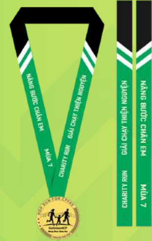
HUY CHƯƠNG COMPLETION MEDAL