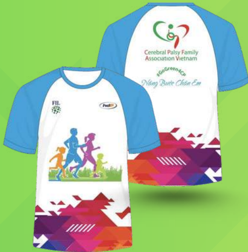
ÁO SỰ KIỆN EVENT SINGLET